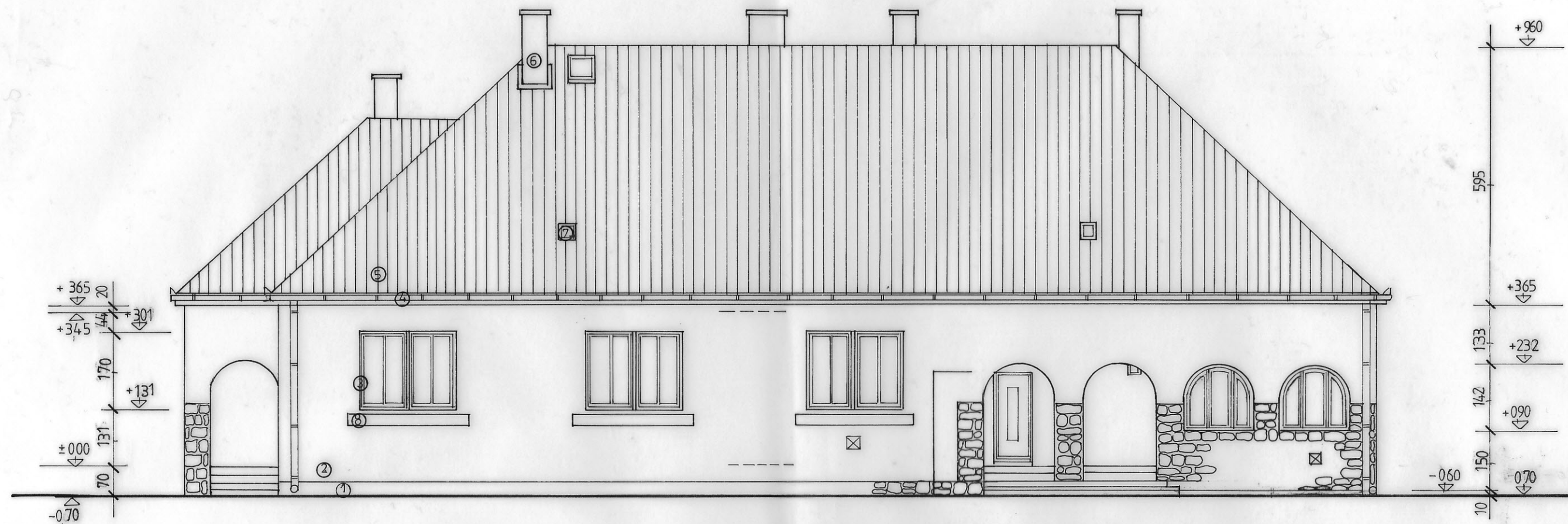
Felmérés Délnyugati homlokzat m = 1:100